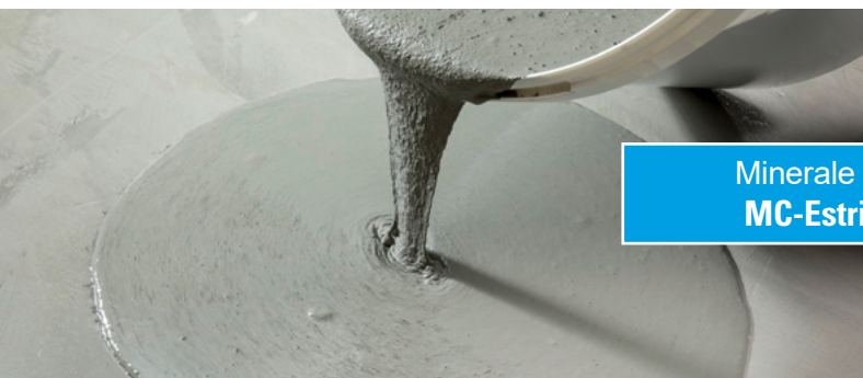
Minerale hechtbrug MC-Estribond MB