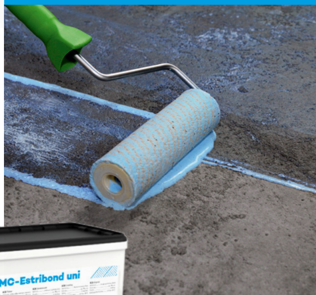
Grondering van zuigende ondergronden (1:1 tot 1:2 met water vedund)