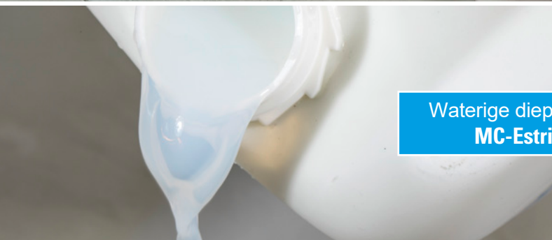
Waterige diepte grondering MC-Estribond T 15