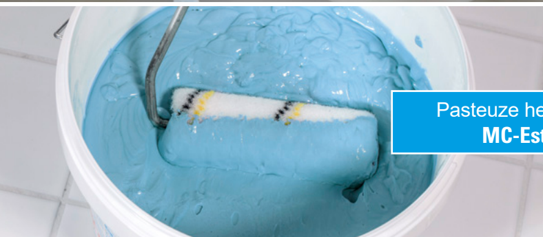
Pasteuze hechtgrondering MC-Estribond uni